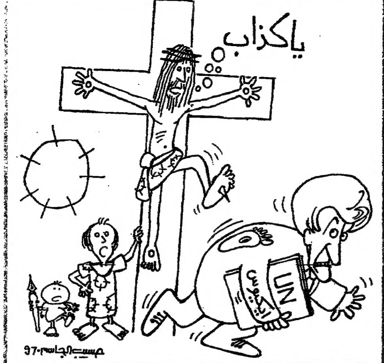
مسرح الجاسوس 37

ومؤدى القول ان الحديث عن السوق العربية المشتركة في غياب التضامن العربي وهم من الاوامم، فالسوق العربية المشتركة ليست مجرد دعوة لتطوير السياحة بين مصر وبقي الدول العربية، وانما هي في الاساس تفسير ثقافية كاملة هي ثقافة الانتماء وايدائها بثقافة جديدة هي ثقافة الامل من حرية وشعور بها.